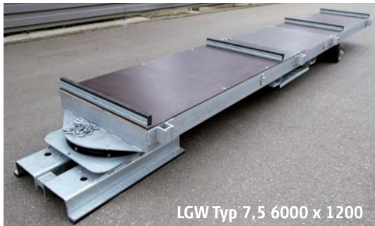
LGW Typ 7,5 6000 x 1200