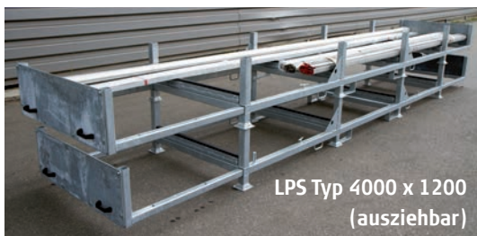
LPS Typ 4000 x 1200 (ausziehbar)