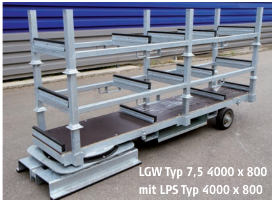
LGW Typ 7,5 4000 x 800 mit LPS Typ 4000 x 800